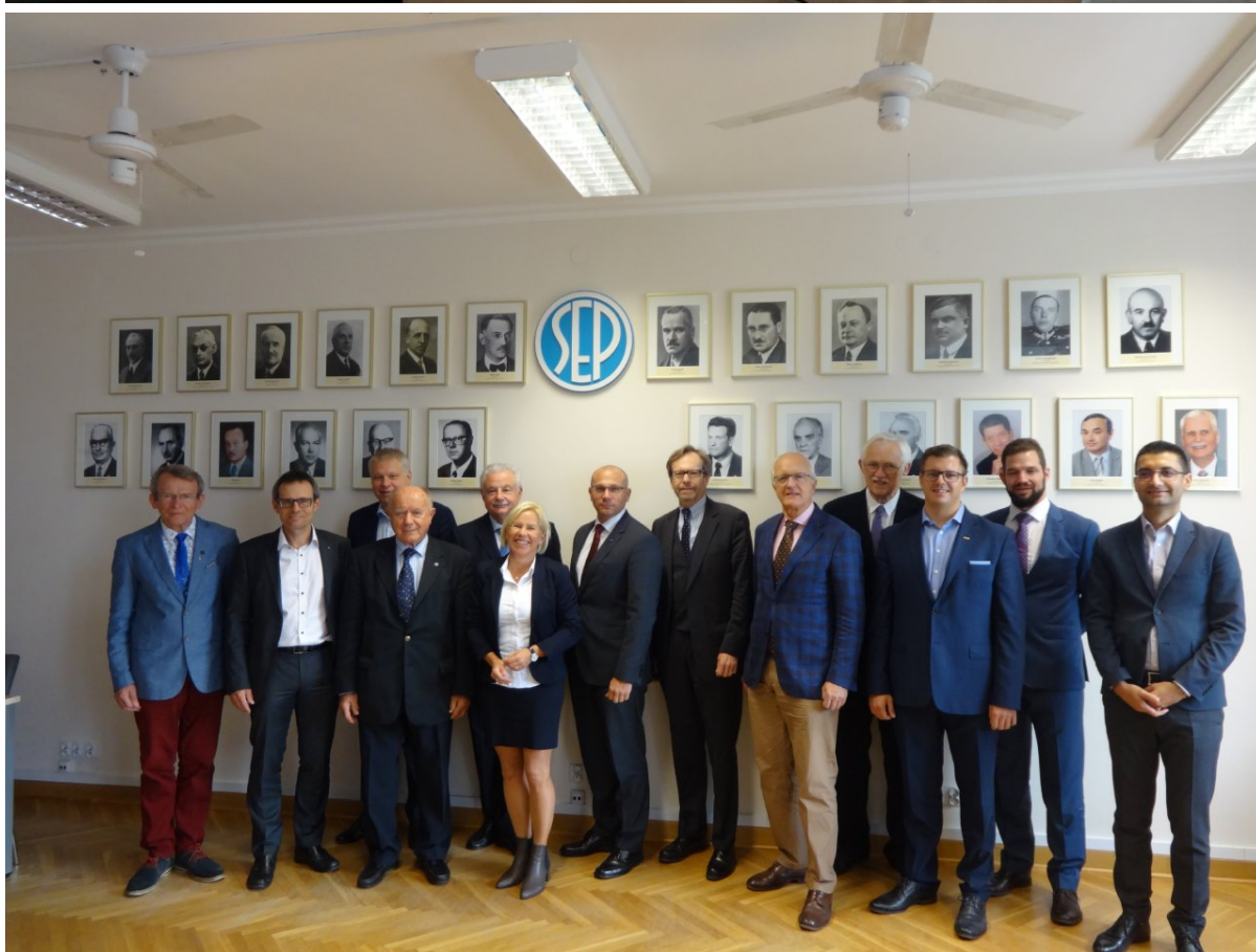
Uczestnicy EUREL General Assembly, w sali konferencyjnej