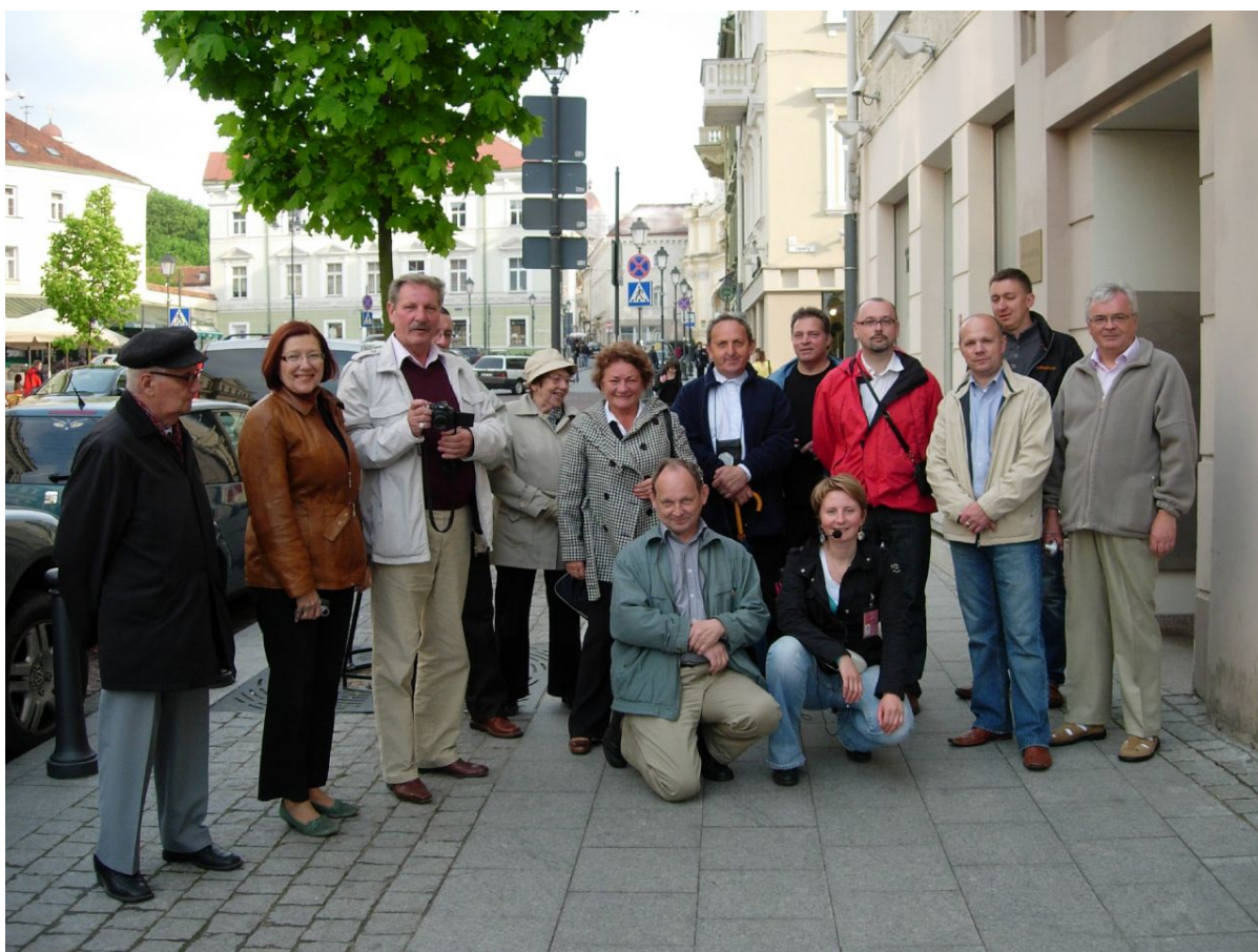
Uczestnicy wyjazdu do Wilna w 2009r.