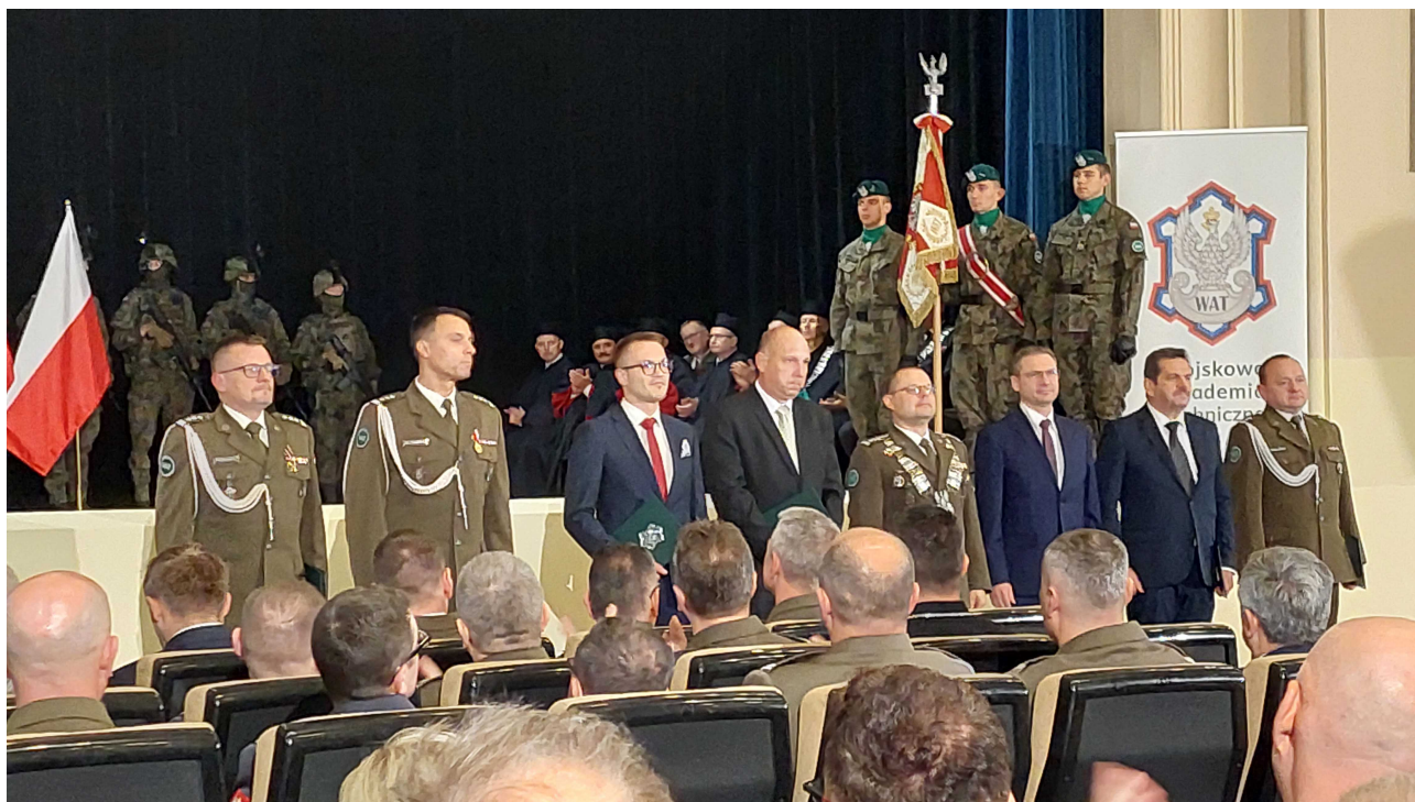
Uroczyste wręczenie dyplomów nowym doktorom habilitowanym WAT