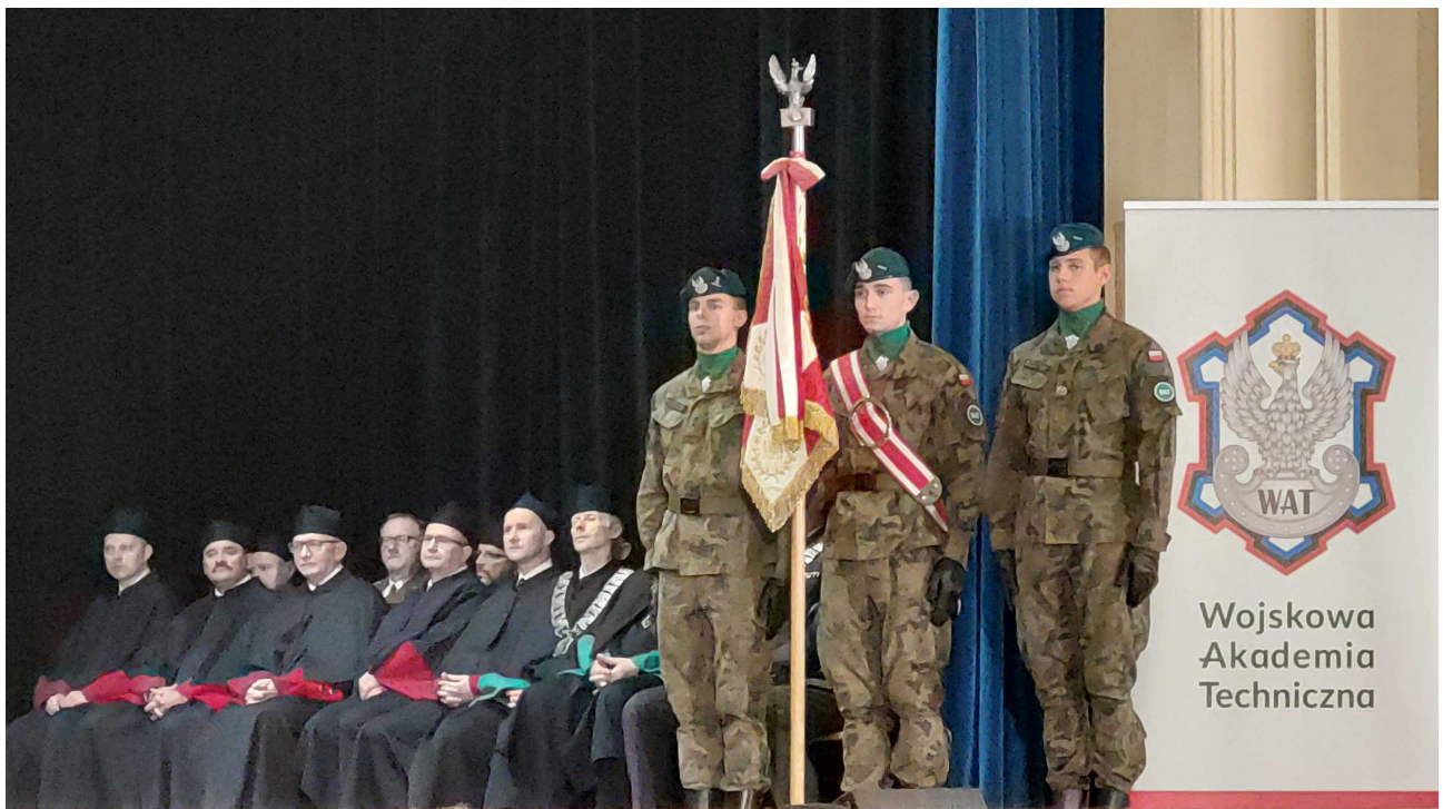
Poczet sztandarowy WAT i zaproszeni Rektorzy wyższych uczelni