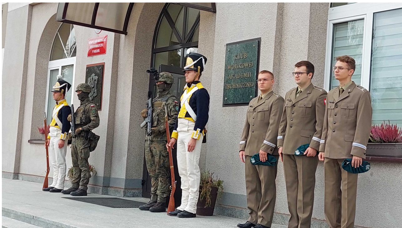
Studenci-Podchorążowie witają Gości w murach Uczelni